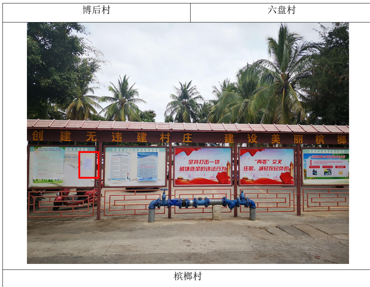
图 3.2-2 现场张贴